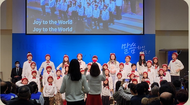
12/15. Jesus Award 준비