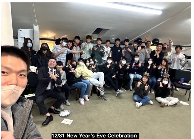
12/31 New Year's Eve Celebration