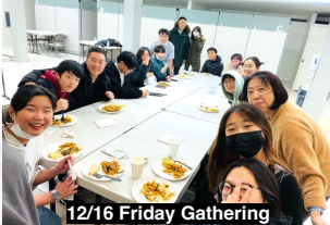
12/16 Friday Gathering