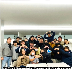
12/23 Victoria's Farewell Gathering