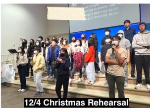
12/4 Christmas Rehearsal