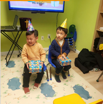
12/11 12월 생일축하