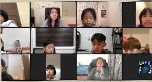
12/01. 큐티 줌 미팅

내가 말했다. “아, 내게 재앙이 있겠구나! 나는 입술이 더러운 사람인데, 입술이 더러운 사람들 사이에 내가 살고 있는데, 내 눈이 왕이신 만군의 여호와를 보았으니!” 이사야 6장 5절