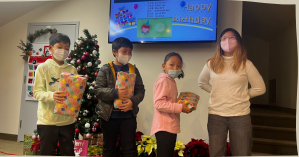
12/11. 12월 생일 축하