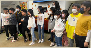
12/04. 말씀 암송