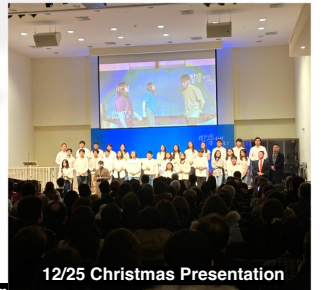
12/25 Christmas Presentation