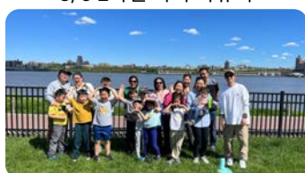
5/14 부모님께 카드 쓰기