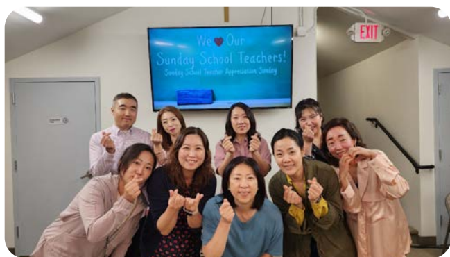
5 / 21 스승의 주일