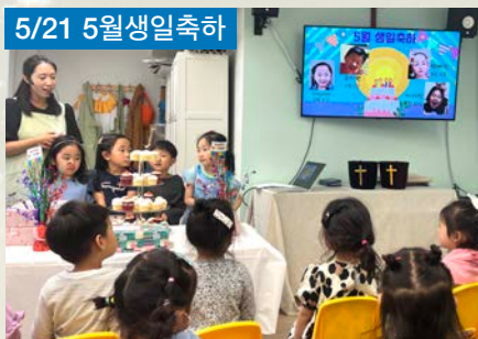
5/21 5월생일 축하