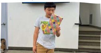
5/7 QT 시상