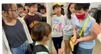
5/7 어린이 주일 게임