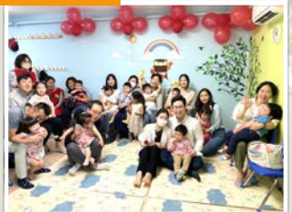
5/21 Teacher Appreciation Sunday