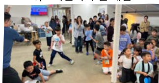
5/7 성경 OX 퀴즈