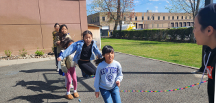
4/14 1,2학년반 무비데이-야외놀이