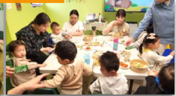
4/21 '예쁜 내 얼굴을 만들어요' 간식 만들기