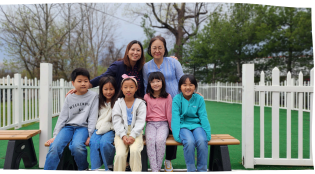
4/14 3학년반 야외수업