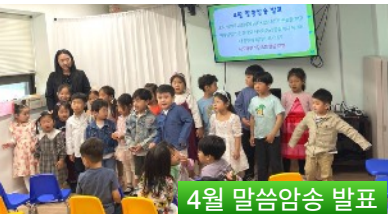
4월 말씀암송 발표