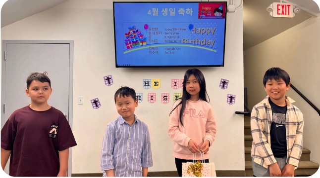
4/28 생일 축하