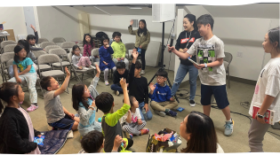
4/14 1,2학년반 무비데이-영화퀴즈