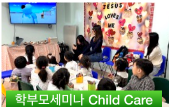
학부모세미나 Child Care