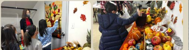
감사 편지와 과일 드리기