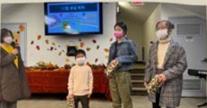
11/27 11월 생일 축하