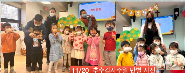
11/20 추수감사주일 반별 사진