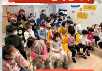
11/13 주일 예배