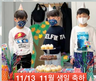
11/13 11월 생일 축하

“또 내게 말씀하시되 이루었도다 나는 알파와 오메가요 처음과 마지막이라” 요한계시록 21:6a