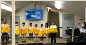
11/13 글로리 찬양대