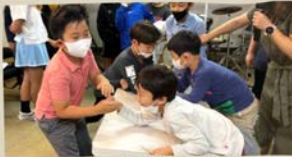
11/06 누가 제일 강한가요?

내가 말했다. “아, 내게 재앙이 있겠구나! 나는 입술이 더러운 사람인데, 입술이 더러운 사람들 사이에 내가 살고 있는데, 내 눈이 왕이신 만군의 여호와를 보았으니!” 이사야 6장 5절