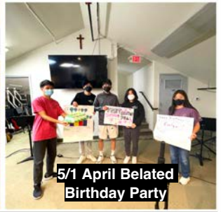
5/1 April Belated Birthday Party