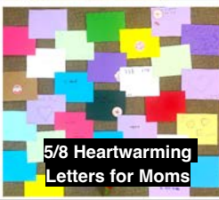
5/8 Heartwarming Letters for Moms