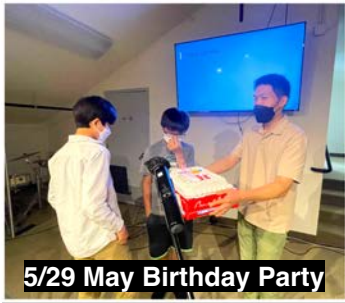
5/29 May Birthday Party