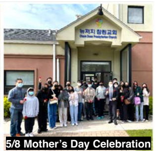
5/8 Mother's Day Celebration