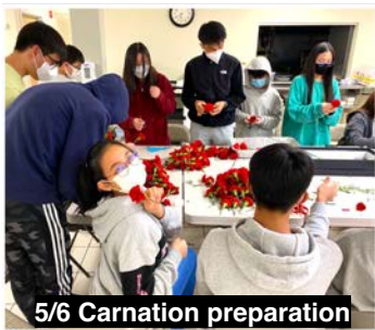
5/6 Carnation preparation