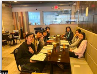
11/17 Bowling Outing