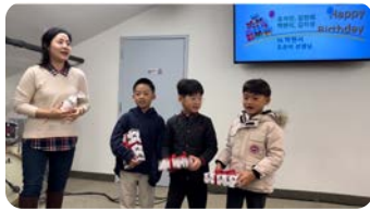
11/16 패밀리터치 부모 세미나 참여