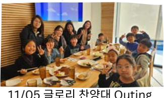
11/05 글로리 찬양대 Outing