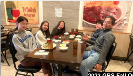
2023 GBS Fall Outing