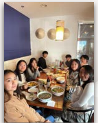
11/26 Recreation Day