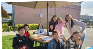
11/05 1,2학년 야외활동 1