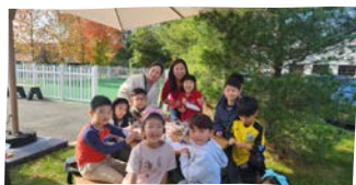
11/05 1,2학년 야외활동 2