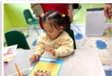
10/22 즐거운 공과 활동