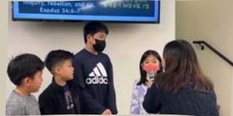
3/12 말씀 암송 발표 2