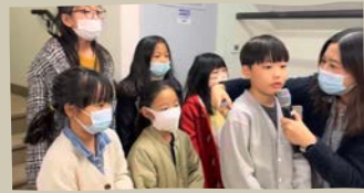
3/12 말씀 암송 발표 1