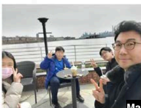
March GBS Outings