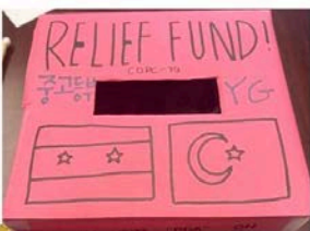
3/12 Syria & Turkey Relief Fund