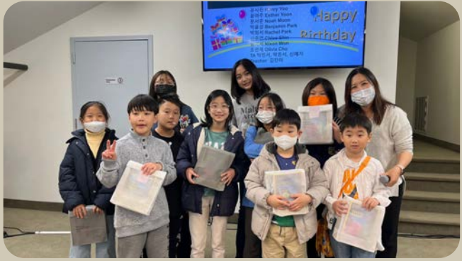
3/26 큐티 시상