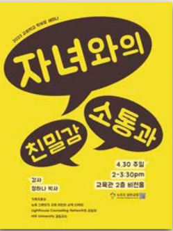
Parenting Seminar Poster

Date: 6/25(Sun)-6/27(Tue) Location: Tuscarora Conference Center Address: 3300 River Road, Mt. Bethel, PA 18343 Cost: $80 | Click here to sign up!