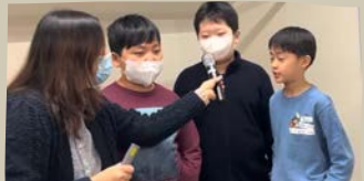
3/12 말씀 암송 발표 3