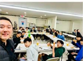
3/10 Friday Gathering