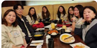
12/17 교사&가족 송년 모임