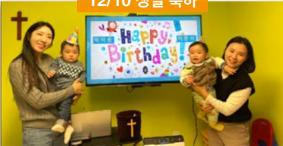
12/10 생일 축하

'하나님이 세상을 이처럼 사랑하사 독생자를 주셨으니 이는 그를 믿는 자마다 멸망하지 않고 영생을 얻게 하려 하심이라'