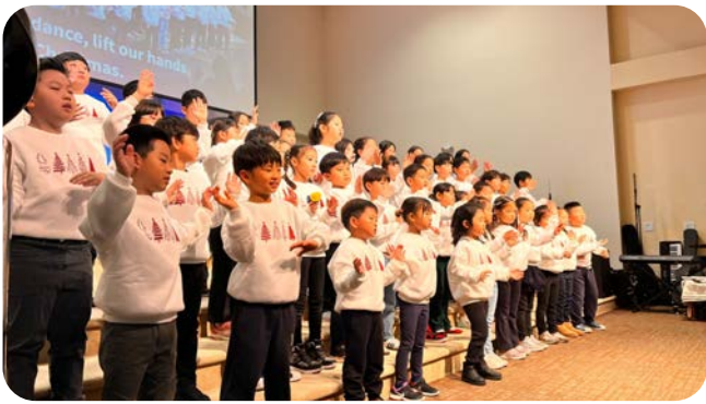
12 / 25 성탄절 찬양 발표